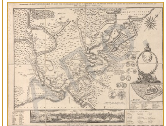
Χάρτα του Ρήγα, Βιέννη, 1797